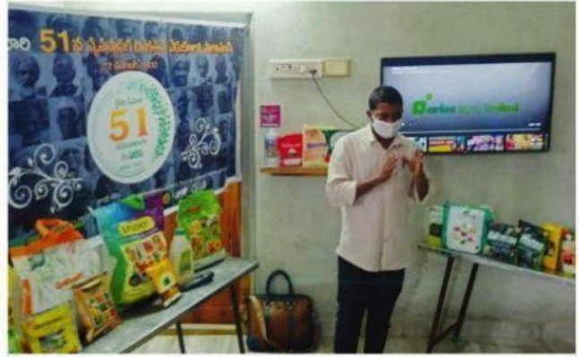
రైతులకు అవగాహన కల్పిస్తున్న దృశ్యం