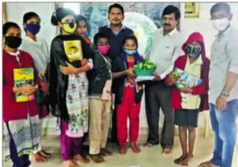
Notebook and Pen Distribution