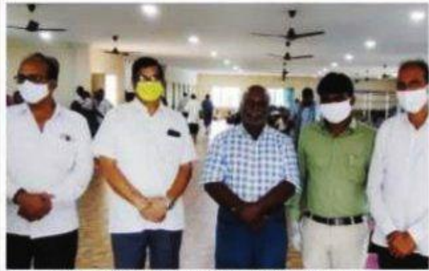
వేడుకల్లో పాల్గొన్న ఏరీస్ కంపెనీ ప్రతినిధులు

ఖమ్మం బ్యూరో, నవంబర్ 27 (ప్రభ న్యూస్): ఏరీస్ ఆగ్రో కంపెనీ లిమిటెడ్ వారి 51వ ఆవిర్భావ (వార్షిక) దినోత్సవ వేడుకలను ఘనంగా నిర్వహించారు. శుక్రవారం ఖమ్మం నగరంలోని అన్నం సేవా ఫౌండేషన్ అనాథ