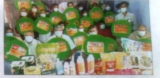
ఎరువులు చల్లెందుకు ఉపయోగించే పరికరాలతో రైతులు